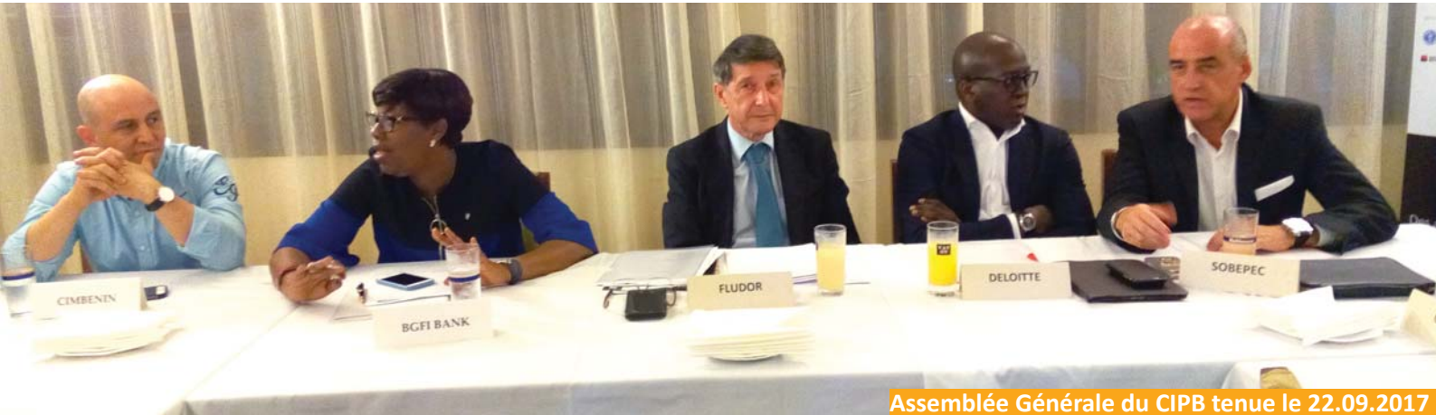
Assemblée Générale du CIPB tenue le 22.09.2017