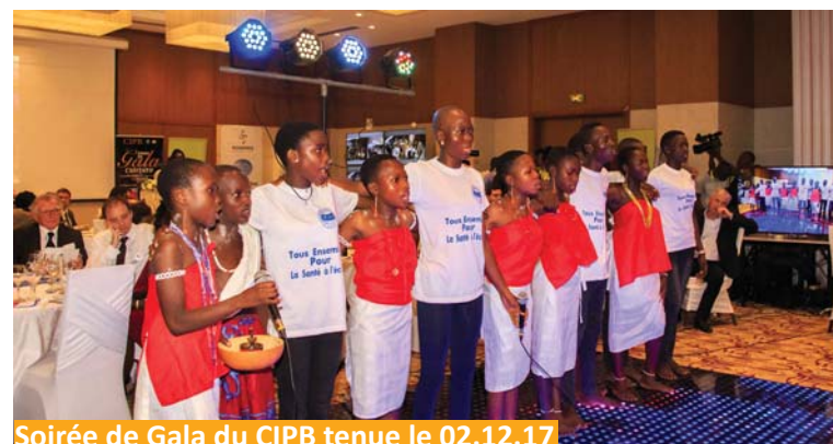
Soirée de Gala du CIPB tenue le 02.12.17

çais. Cette activité a été soutenue par ETISALAT, Sponsor Officiel et d'autres Sociétés Membres et non Membres du CIPB. Cette soirée placée sous le parrainage de l'Unicef a réuni presque 200 invités et permis de collecter des fonds au profit du CAEB.