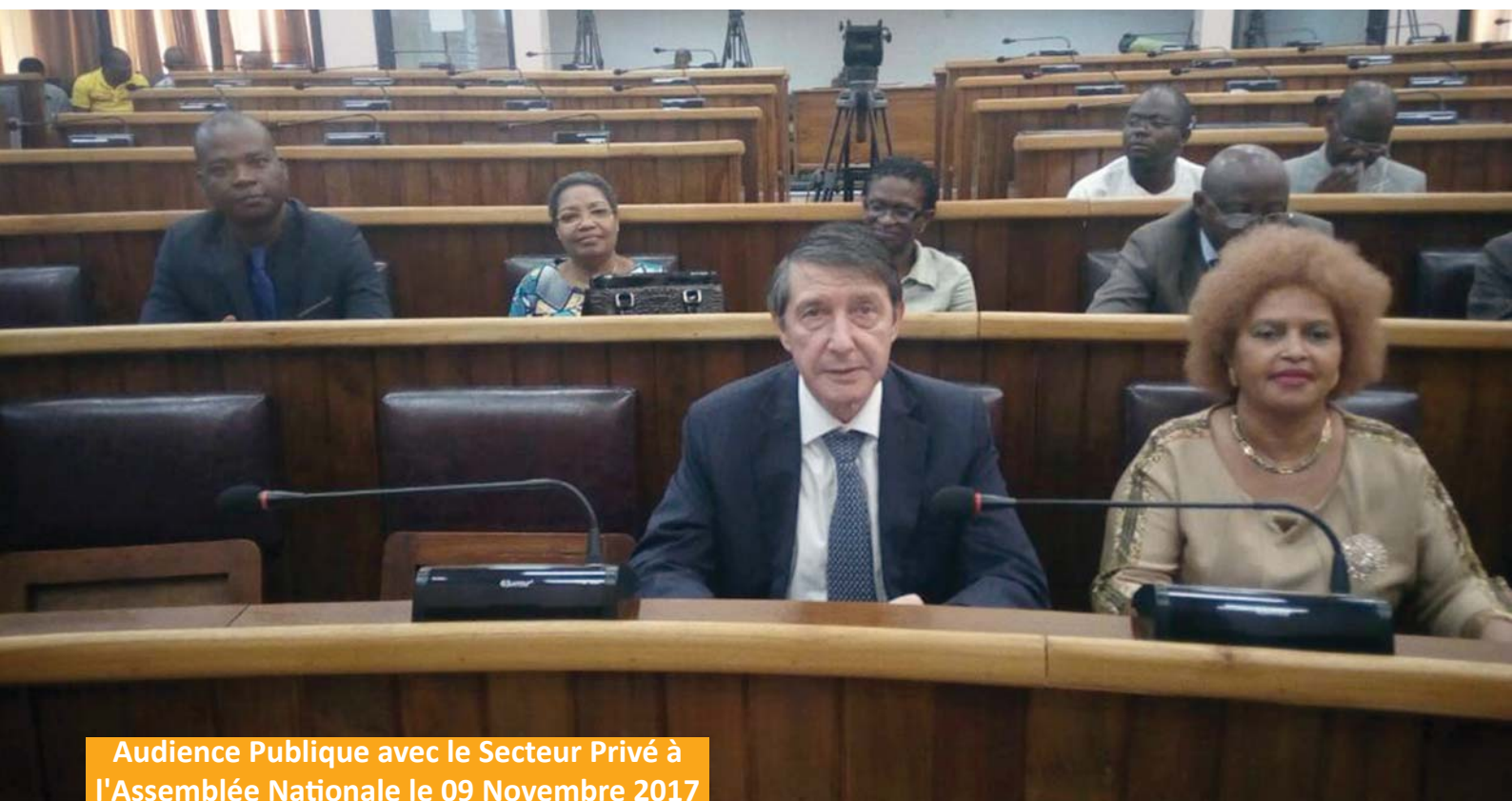
Audience Publique avec le Secteur Privé à l'Assemblée Nationale le 09 Novembre 2017