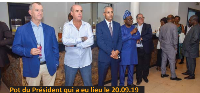
Pot du Président qui a eu lieu le 20.09.19

Le 20 septembre, le CIPB a organisé le Pot Président pour créer un lieu d'échange, de partage et de recueil des problèmes des membres du CIPB en vue de les aider dans leurs difficultés.