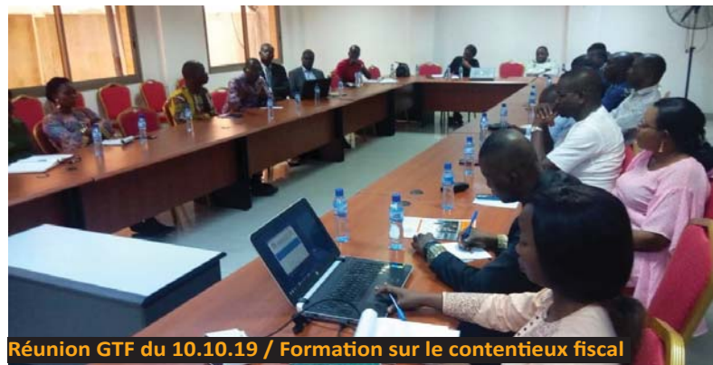
Réunion GTF du 10.10.19 / Formation sur le contentieux fiscal

Le 14 novembre 2019 , il s'est réuni pour faire le point de son passage à l'Assemblée Nationale et la réflexion a été menée sur la suite de ce plaidoyer.