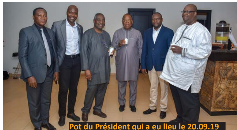
Pot du Président qui a eu lieu le 20.09.19