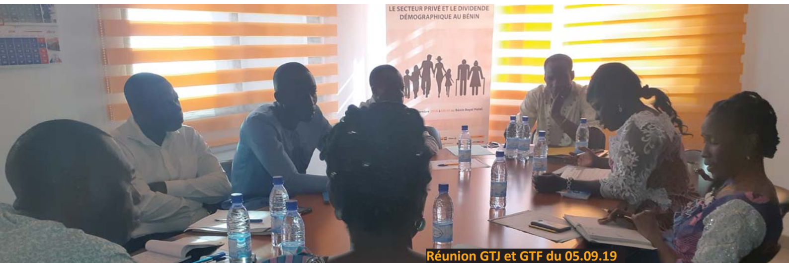
Réunion GTJ et GTF du 05.09.19

Le 21 novembre , dans le cadre de l'Exécution du Plan de Travail Annuel du Groupe de Travail Justice, le GTJ a organisé à l'attention de ses membres et des membres des Groupe de Travail Justice et Fiscalité, une séance de sensibilisation sur le concept Responsabilité Sociétale des Entreprises (RSE) le thème abordé s'intitulait : « La RSE et le développement des entreprises ». Les communicateurs ont incité les entreprises à pratiquer une RSE inclusive c'est-à-dire, permettre aux personnes en situation d'handicap d'avoir accès à un emploi.