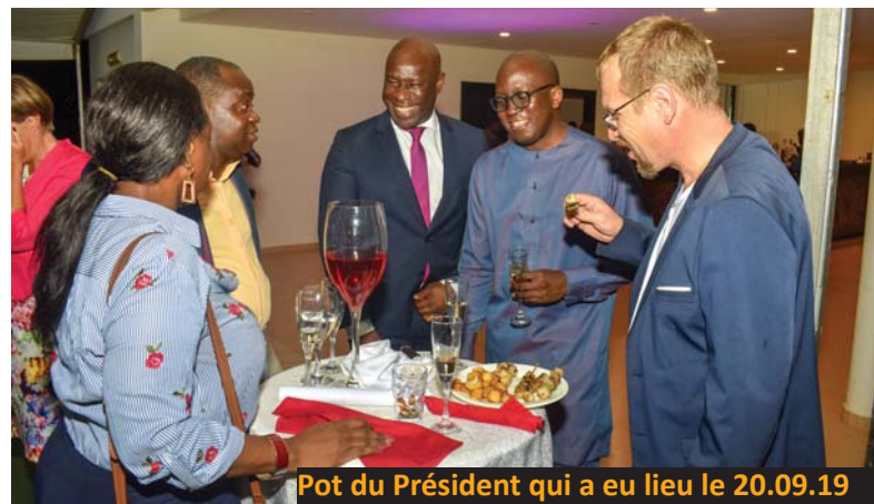
Pot du Président qui a eu lieu le 20.09.19