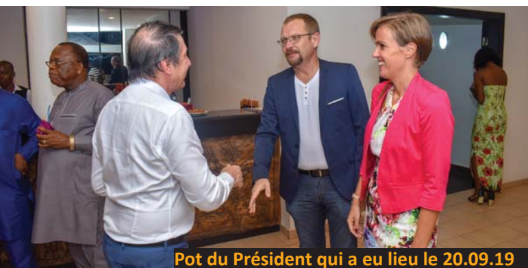
Pot du Président qui a eu lieu le 20.09.19