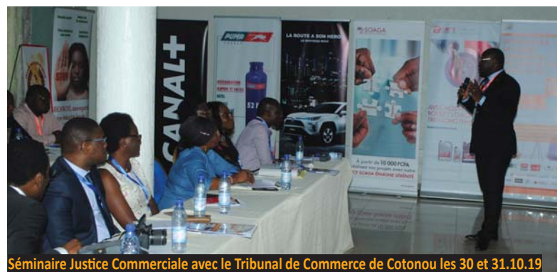
Séminaire Justice Commerciale avec le Tribunal de Commerce de Cotonou les 30 et 31.10.19