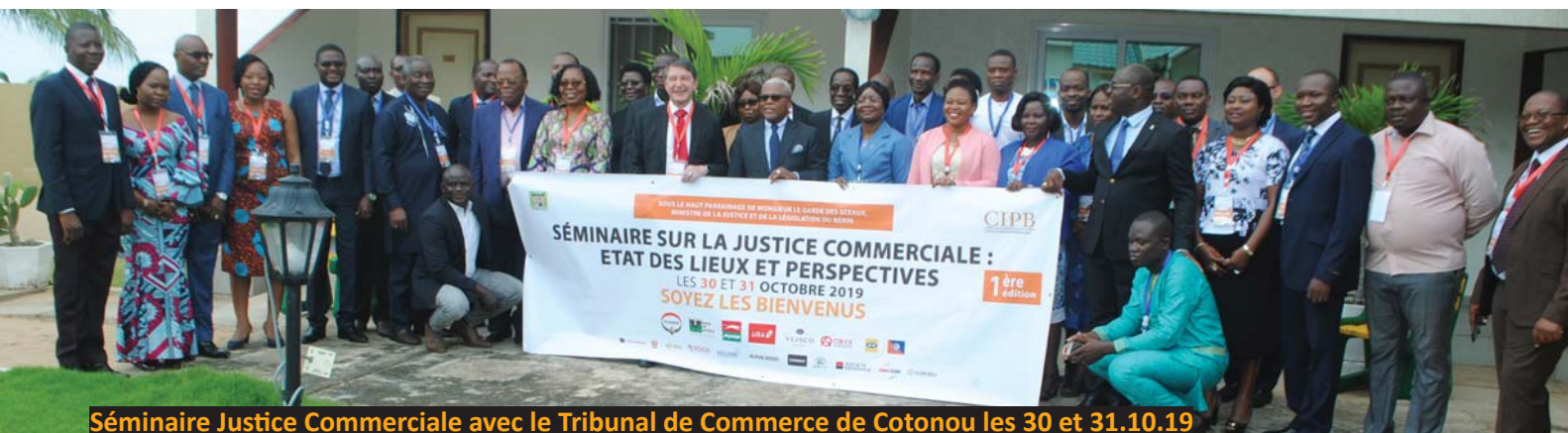
Séminaire Justice Commerciale avec le Tribunal de Commerce de Cotonou les 30 et 31.10.19