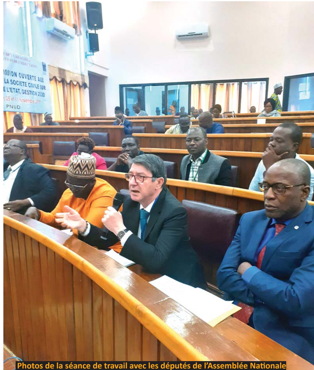
Photos de la séance de travail avec les députés de l'Assemblée Nationale

Dans son mot de clôture, le Président de la Commission des Finances et des Echanges a remercié